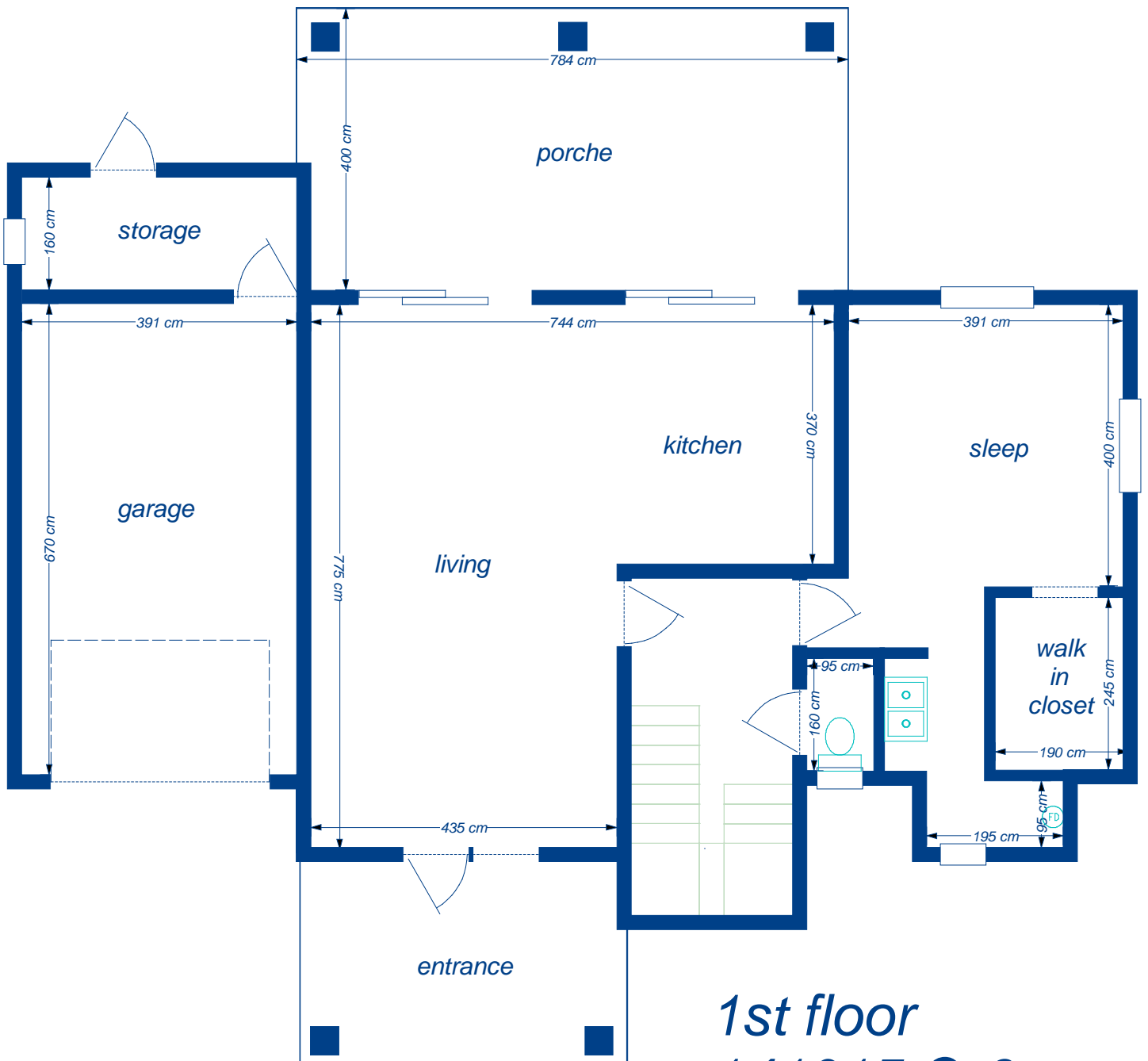
1st floor 141015 Q-6